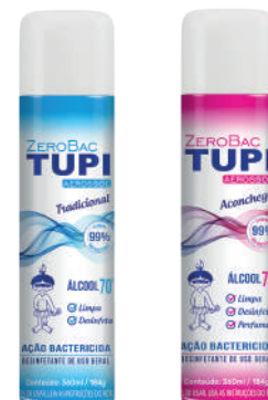
Zerobac TUPI 70° INPM Aerossol NCM 38089429