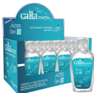
Álcool GEL ANTISSEPTICO HIDRATANTE 70° INPM - NCM 38089429