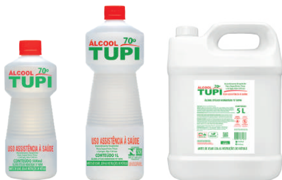
Álcool Líquido 70° INPM NCM 38089429