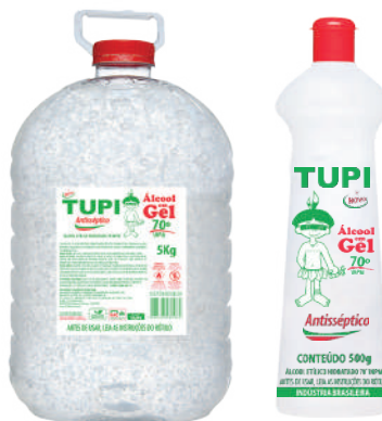
Álcool em Gel 70° INPM NCM 38089429